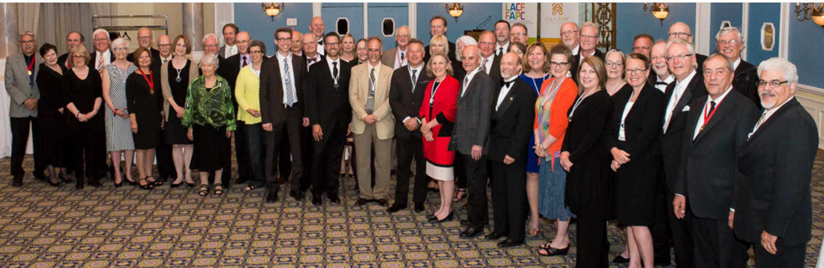
Fellows banquet in Ottawa - 2014 - gala des Associés à Ottawa

Saturday, May 23 rd , 2015 (México) Samedi 23 mai 2015 (Mexico)