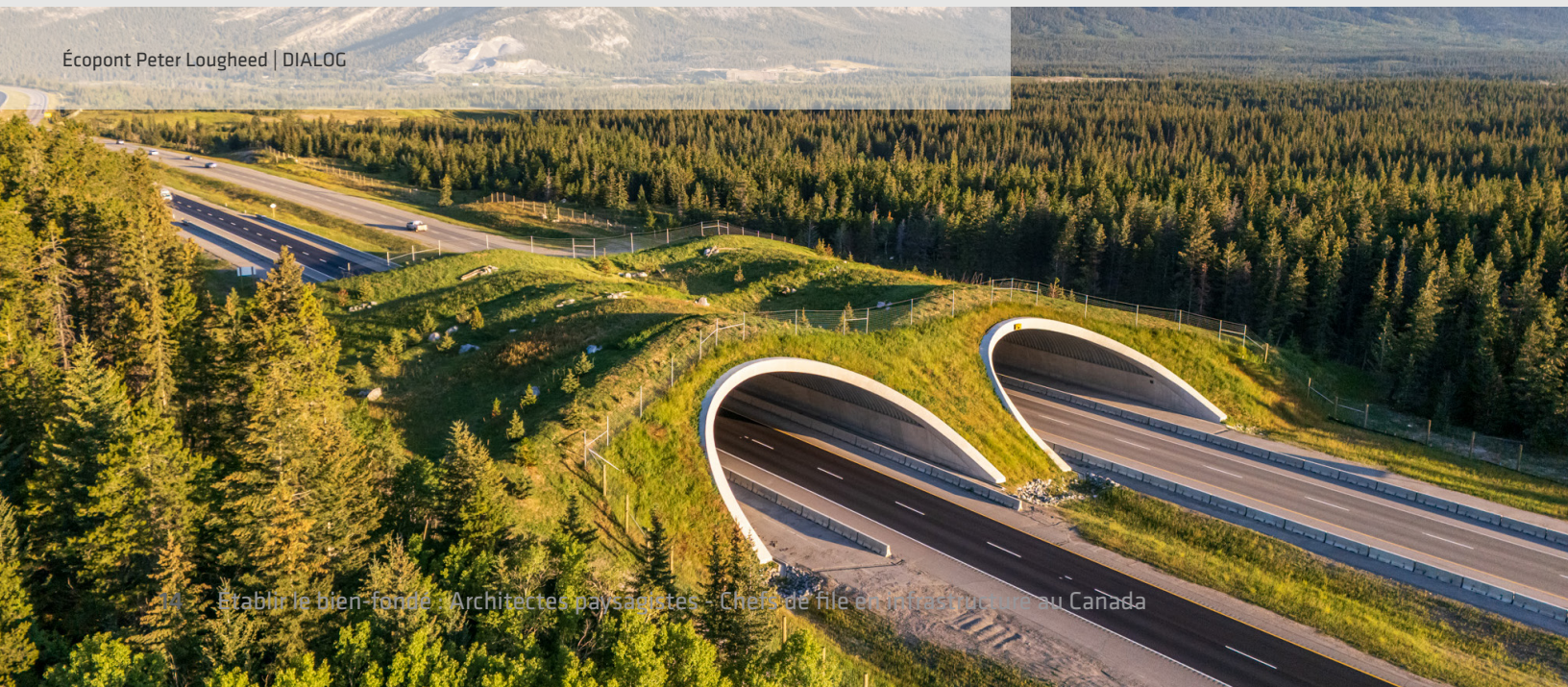
Écopont Peter Lougheed | DIALOG