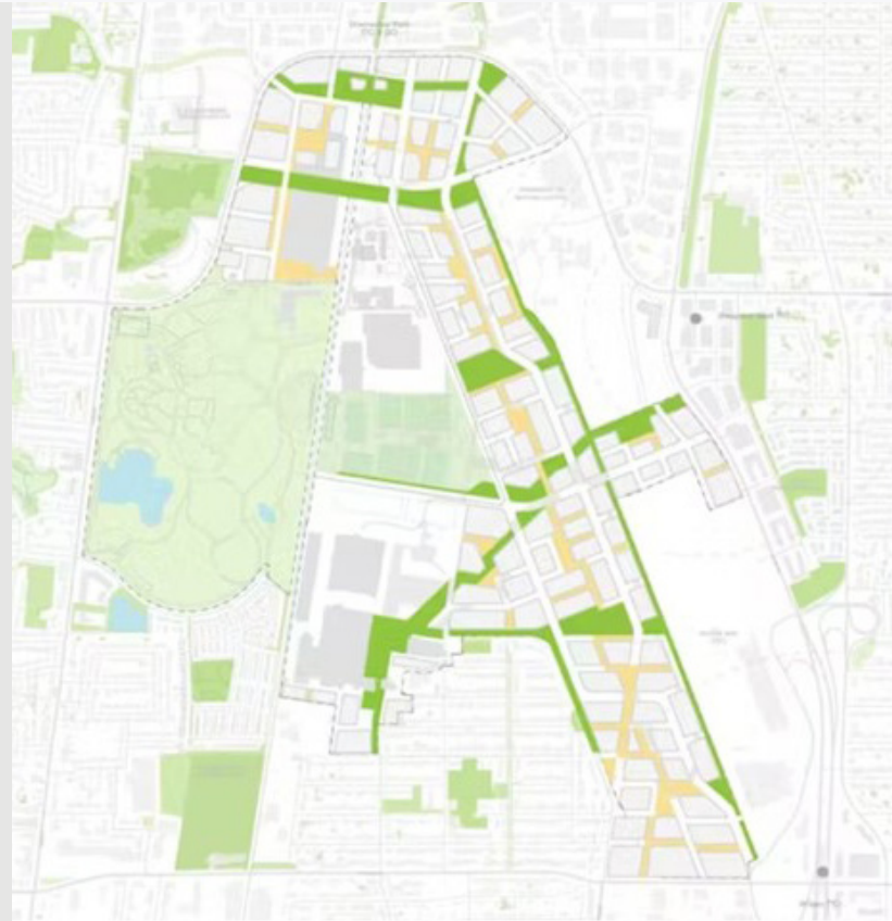
Le plan-cadre propose un nouvel aménagement associant nature, espace public et bâtiments | SLA

Le projet a remporté de nombreux prix grâce à sa vision « ville-nature », son plan-cadre paysager et son processus de planification collaborative.