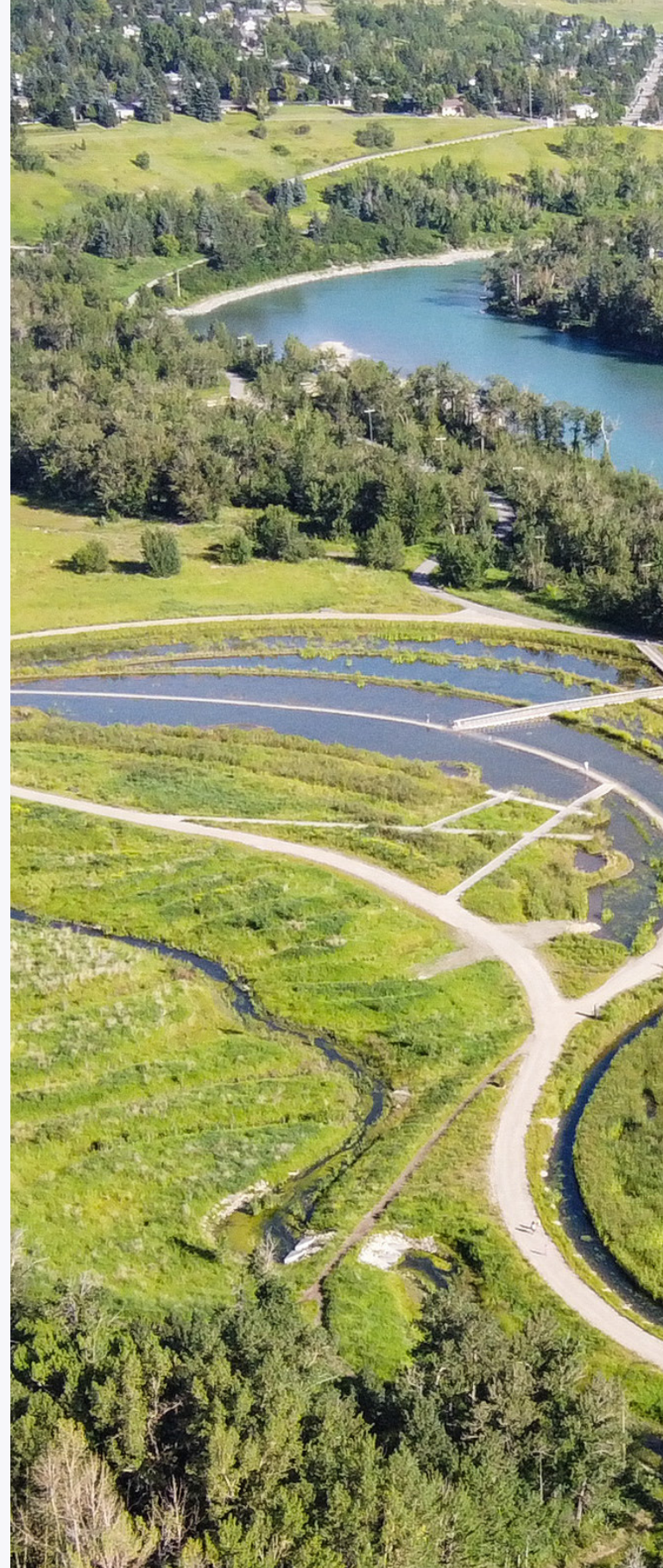
Parc Dale Hodges à Calgary (Alberta) – Concilier les infrastructures durables O2 Planning + Design